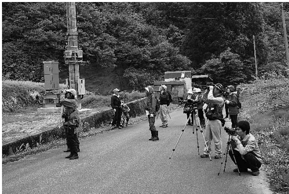
調査の様子 (2018年5月13日 竜光小芋川)