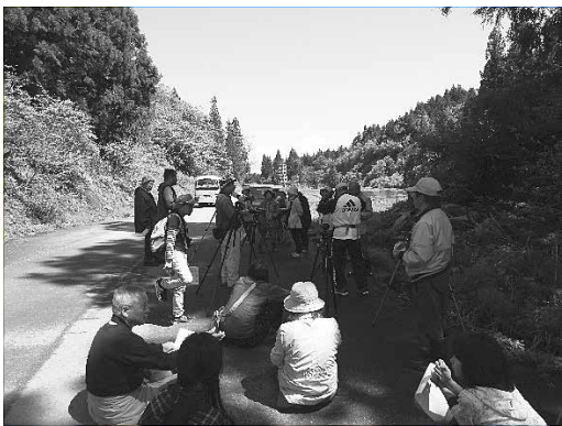
調査の様子 (2017年5月14日 魚野地)