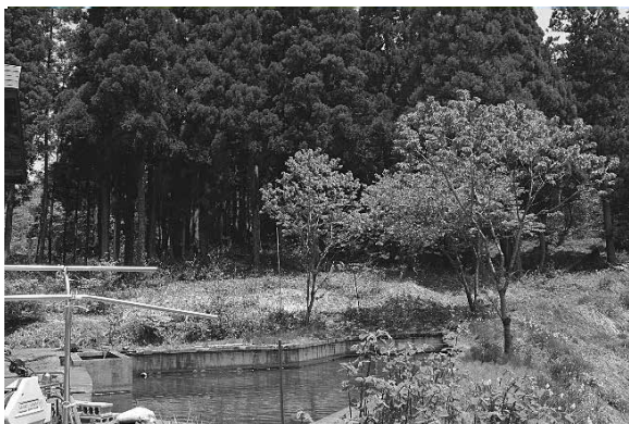
熊取杉林（福山地域）