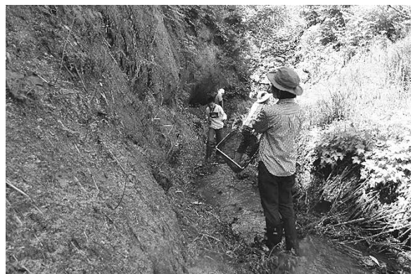
調査の様子 (5月20日 小芋川)