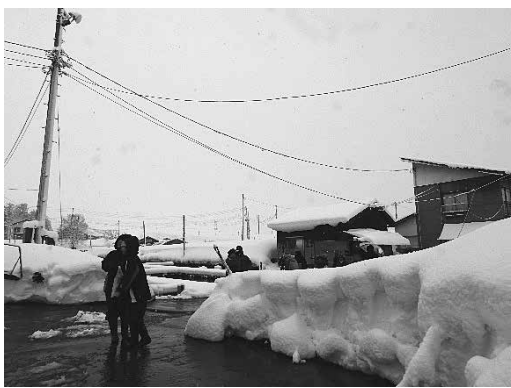
調査の様子 (2018年2月18日 梅田養魚場)