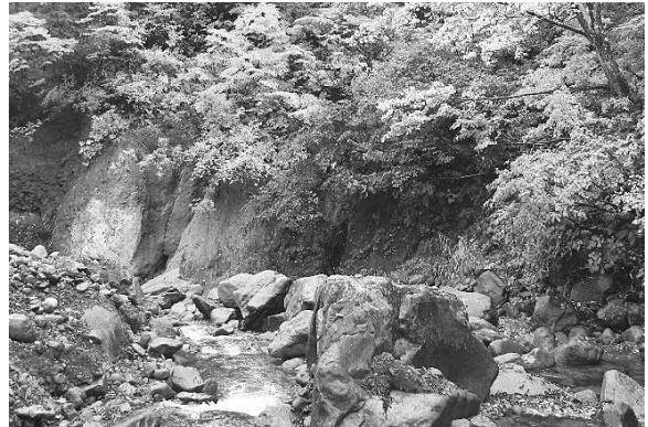
浅草岳右沢（入広瀬地域）