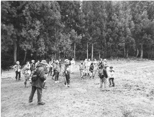
調査の様子 (2017年5月7日 杉ノ入沢)