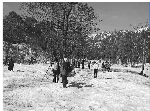
調査の様子 (2017年5月21日 銀山平)