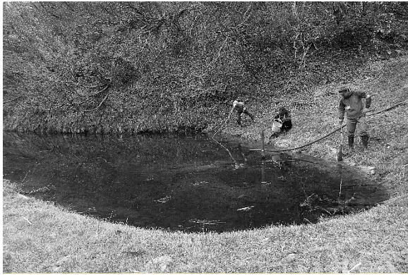
調査の様子 (4月26日 根小屋)