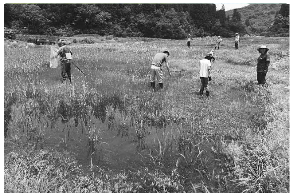
調査の様子 (6月24日 福山)