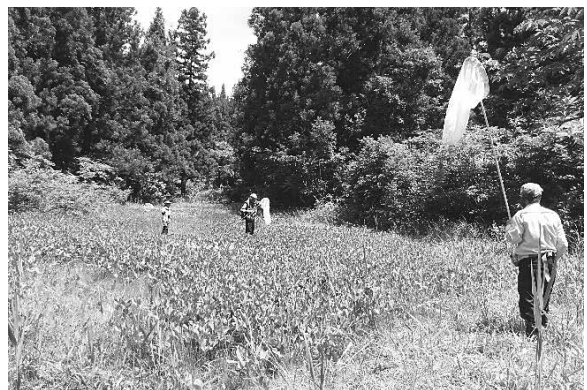
池ノ山の池湿地（守門地域）