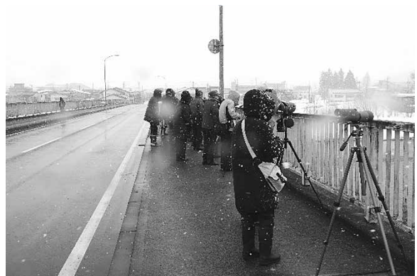
調査の様子 (2019年2月17日 新柳生橋)