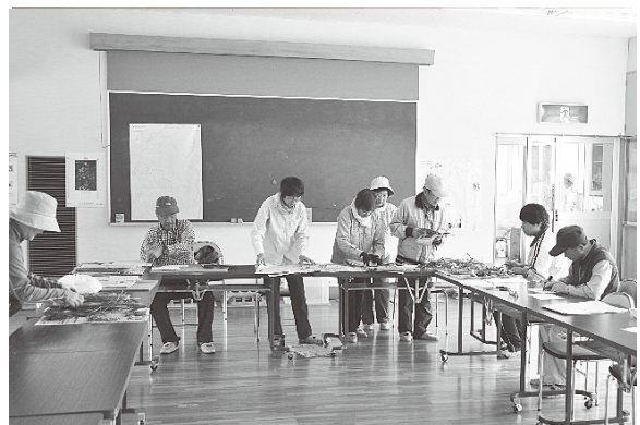
標本作成の様子 (2017年5月2日)