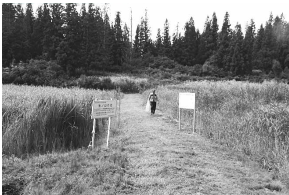
池ノ山の池（守門地域）