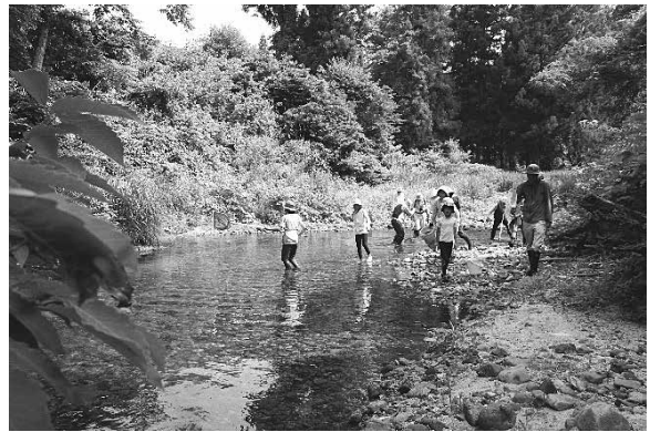
調査の様子 (6月24日 松川)