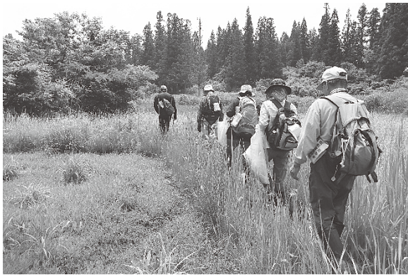
調査の様子(2018年6月26日 池ノ山の池)