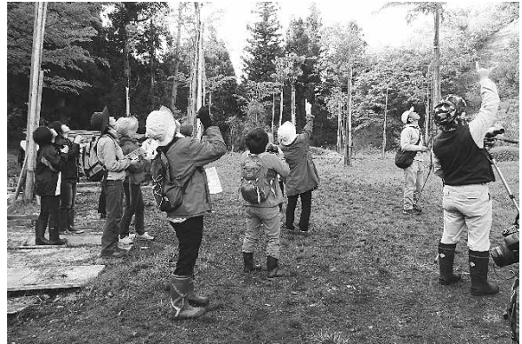
調査の様子 (2018年5月6日 杉ノ入沢)