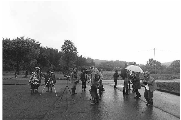
調査の様子 (2018年5月20日 福山新田)