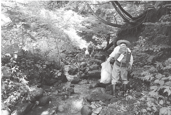
調査の様子 (2017年7月20日 鳥屋ヶ峰)