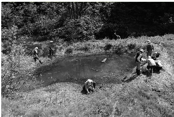
調査の様子 (5月20日 竜光)