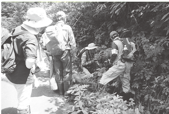
調査の様子 (2017年8月17日 鳥屋ヶ峰)