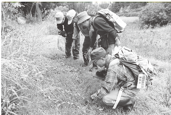
調査の様子(2018年9月30日 池ノ山の池)