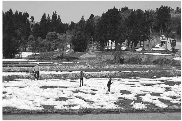
調査の様子 (4月30日 横根)