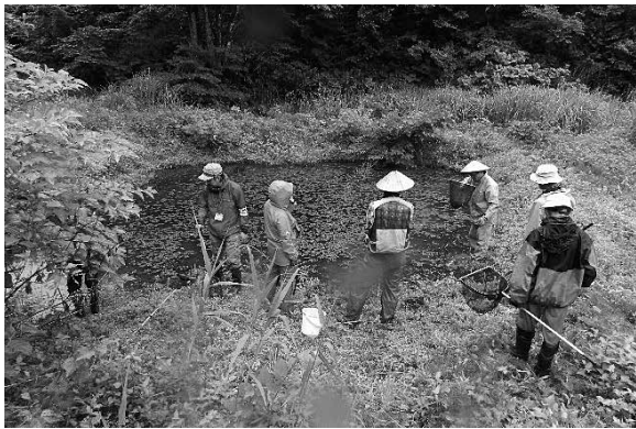
調査の様子 (6月21日 根小屋)