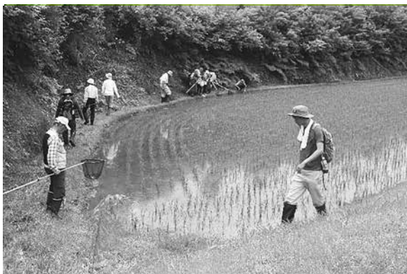
調査の様子 (6月24日 松川)