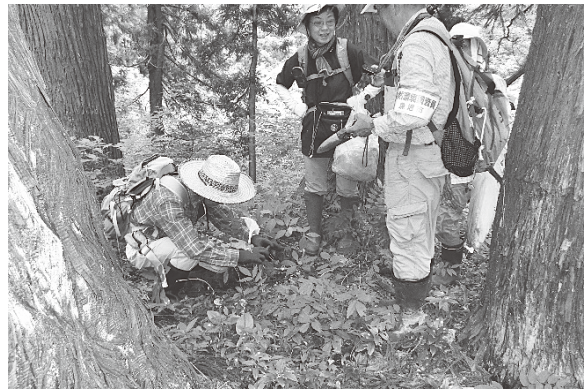
調査の様子(2018年7月11日 池ノ山の池)