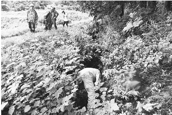
守門岳大原登山口付近（入広瀬地域）