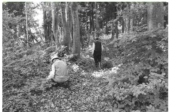
福山新田ブナ林（福山地域）