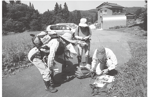
調査の様子 (2017年7月20日 鳥屋ヶ峰)