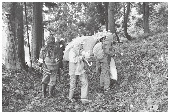
調査の様子(2018年5月17日 池ノ山の池)