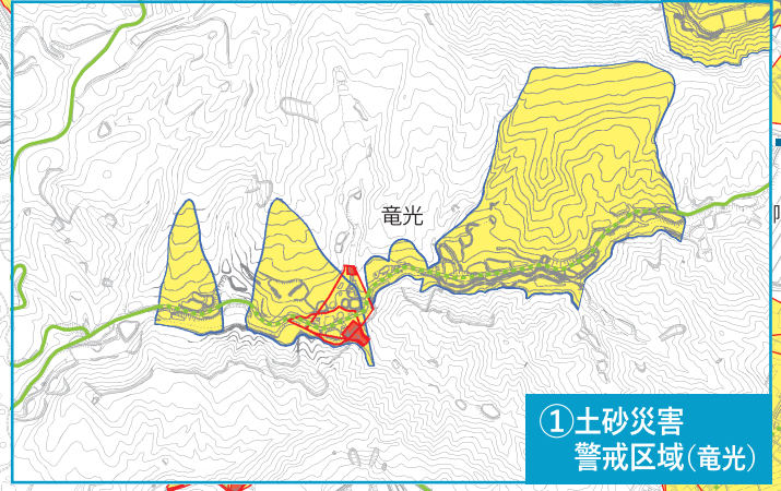
①土砂災害警戒区域(竜光)

※▲は家屋倒壊等氾濫想定区域、土砂災害警戒区域等にかつているため、災害の状況によっては利用が制限される場合があります。 ※■は旧耐震基準の建物で耐震補強されていない施設であるため、災害の状況によっては利用が制限される場合があります。 ※避難所等を開放する場合は、防災行政無線、緊急告知ラジオ、テレビ等を通じてお知らせします。