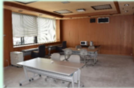
コワーキングスペース

ゆったりとした空間で落ち着いて仕事ができ ます。プリンターや事務用品が使用できます。