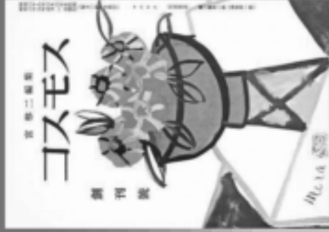
コスモス 創刊 昭和二十六年三月一日発行

47年もの歴史を誇る ——「コスモス」創刊70周年—— この展覧会は、創刊70周年を記念して、創刊以来の歴史を振り返るとともに、最新の活動や取り組みを紹介し、読者の皆様と交流を深めたいと考えています。 展示内容：創刊号から最新の号まで、当時の原稿や写真、挿絵などを展示し、当時の雰囲気を再現します。 期間：令和5年6月3日（土）～令和6年3月31日（日） 会場：宮崎二記念館 入場料：無料